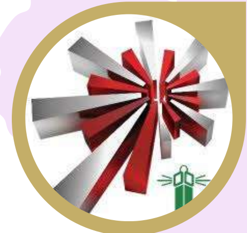
شركة التصوير الجزيئي الطبية المحدودة