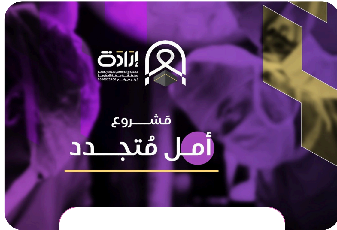
مشروع أمل متجدد