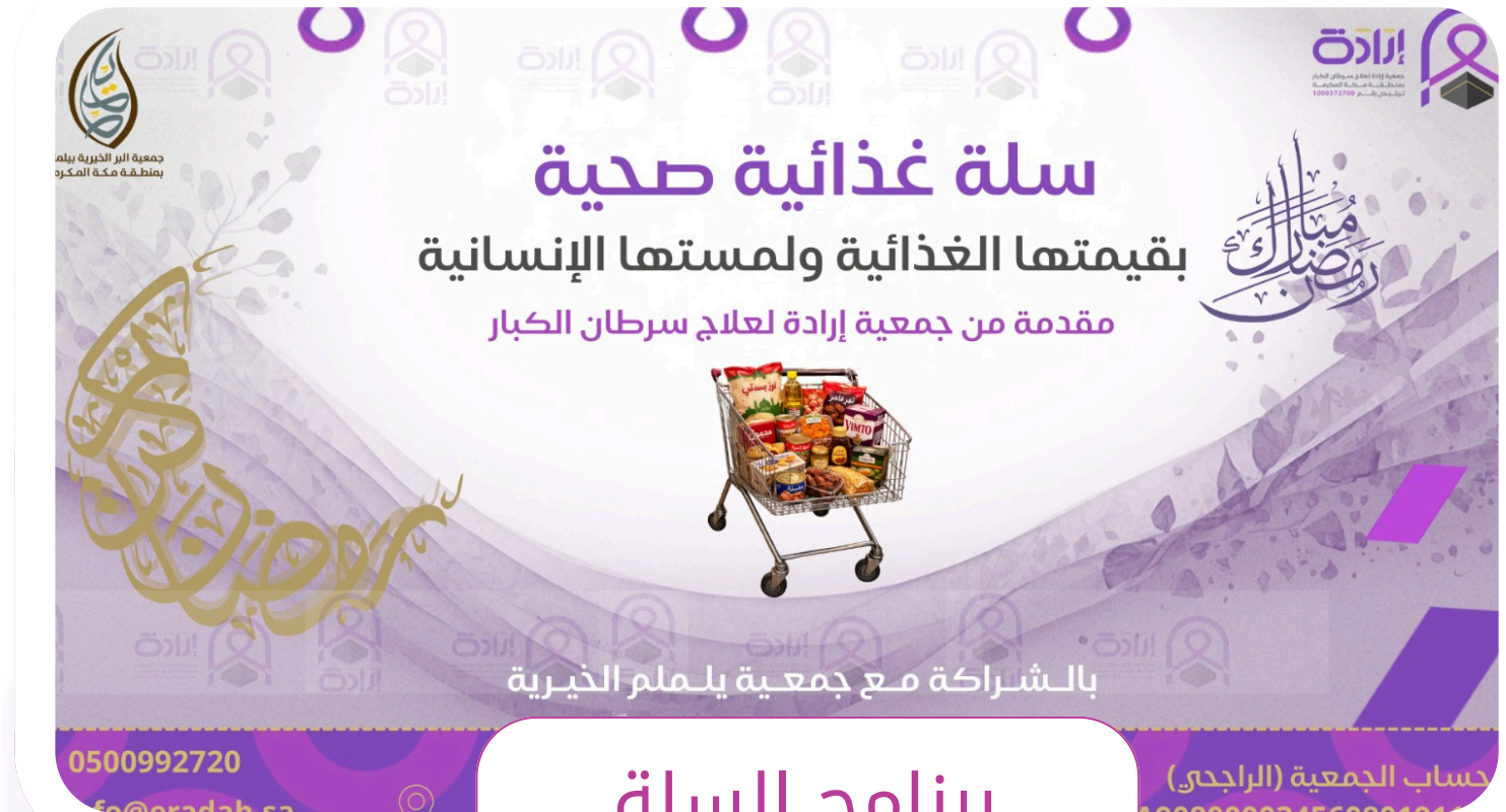
برنامج السلة الغذائية الصحية