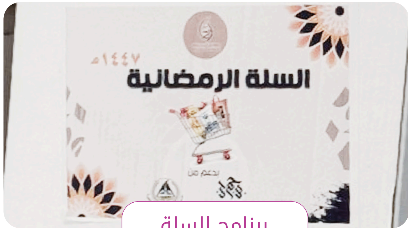
برنامج السلة الرمضانية