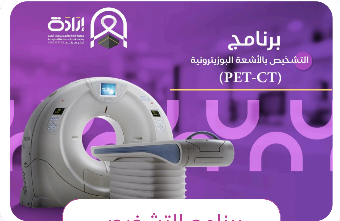
برنامج التشخيص بالاشعة