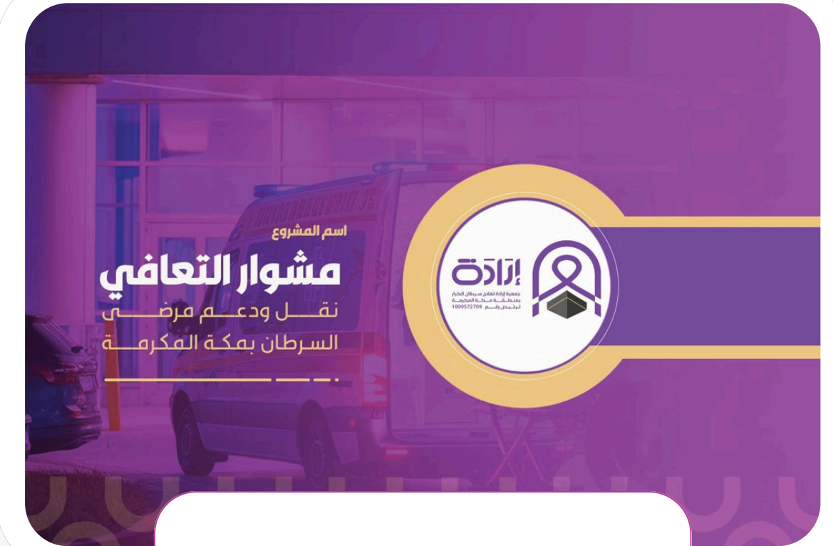
مشروع مشوار التعافي