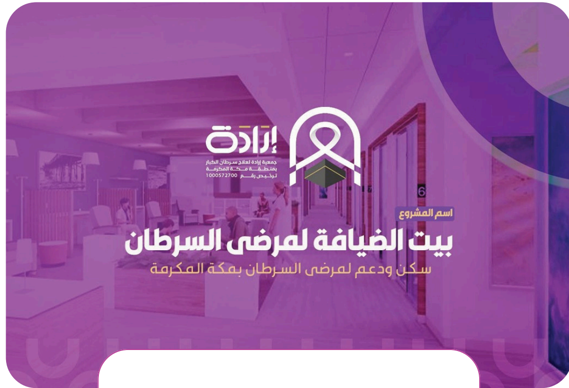
مشروع بيت الضيافة