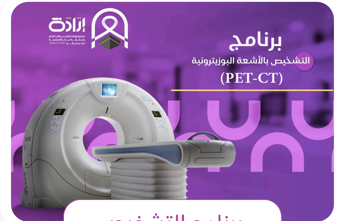
برنامج التشخيص بالاشعة