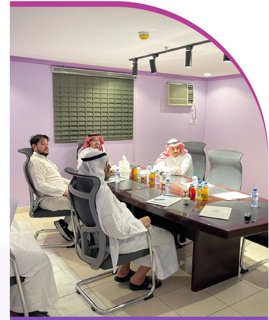
اجتماع مجلس الادارة