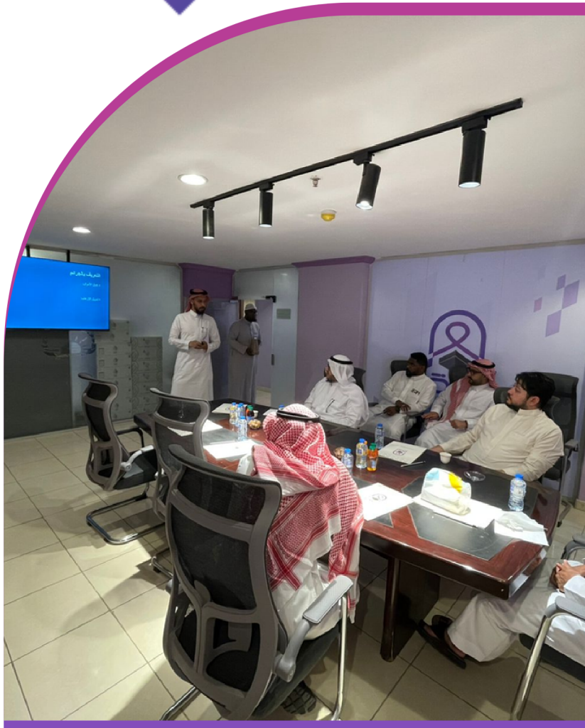
ورشة مكافحة جرائم الارهاب