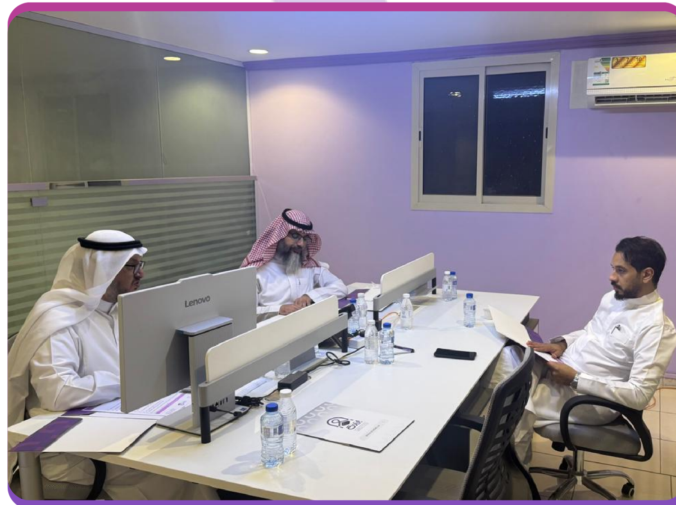
اجتماع اللجنة الطبية (الفنية)